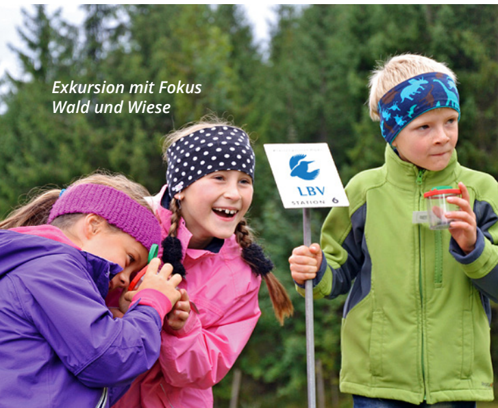
Exkursion mit Fokus Wald und Wiese

Die Angebote für Schulklassen werden von unseren LBV-Umweltbildungseinrichtungen erarbeitet und durchgeführt. Weitere Informationen unter www.lbv.de/umweltstationen